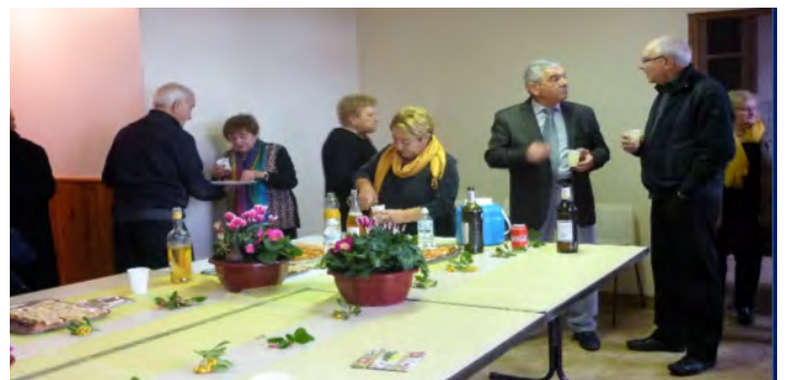
Apéritif et Repas de Noël