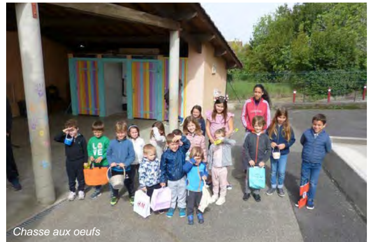
Chasse aux œufs