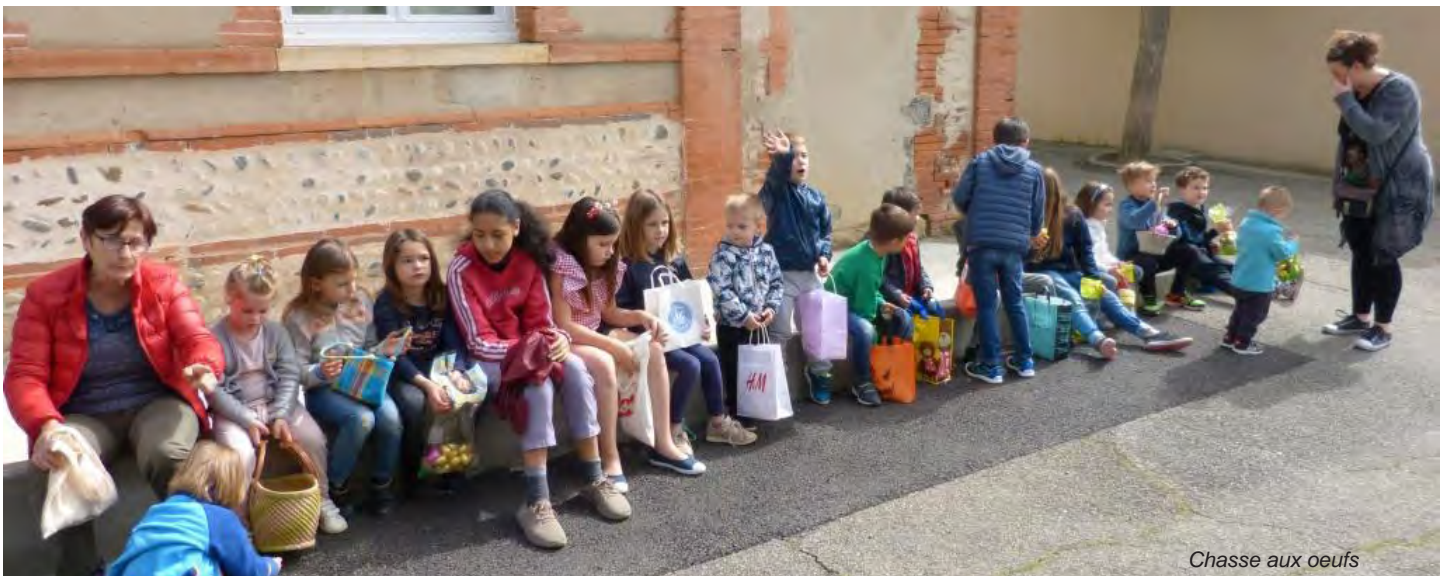
Chasse aux œufs